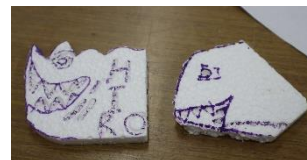
発泡スチロールにデザインしました。

日本の伝統を誇る鑄物産業が自分たちの住む地域で盛んに行われていることを改めて実感できた子供たちは、「ふるさと羽田」の良さを語るができる大人になることと思います。