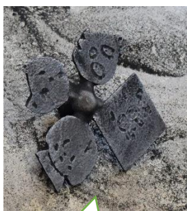
焼きあがった文鎮